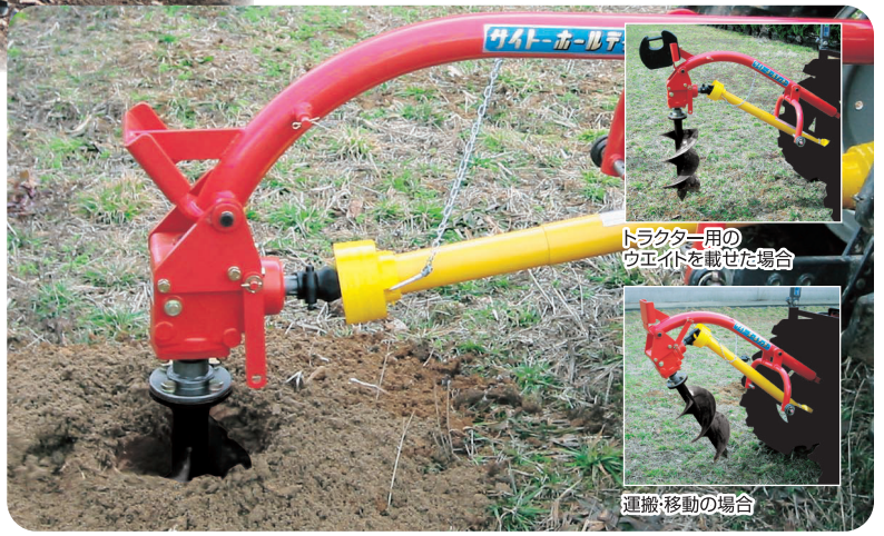
地面が固く、さざりが悪い場合はトラクタ用のウェイトを載せてください。(※本機にはついていません。)